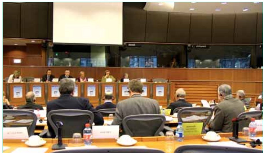
Las mejoras en materia de RSC pasan por una concepción multidisciplinar de la misma.

Para finalizar, los diferentes organismos presentes pidieron la creación de una nueva comunicación sobre RSC, ya que la última fue elaborada en 2006.