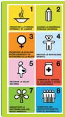
Los estados de NU acordaron los ocho ODM en 2000.

Al lado de los gobiernos, también han de intervenir las organizaciones internacionales y las ONG, así como el sector privado. "La industria sanitaria es parte de la solución de los retos mundiales a los que nos enfrentamos".