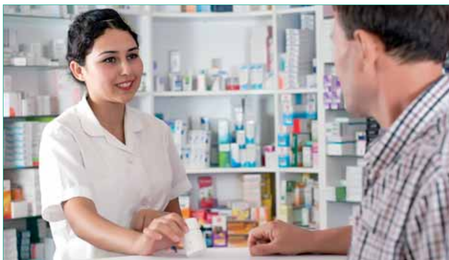
El Colegio General ha participado ya en más de 15 campañas del Plan Nacional sobre Sida.

Este acuerdo no es sino otra evidencia más de la colaboración de las farmacias en la lucha contra esta enfermedad. Desde hace más de 20 años, la profesión farmacéutica colabora con el Ministerio de Sanidad en la puesta en marcha de estrategias y políticas de prevención en España. Según los datos del último Informe Anual sobre Actividades de Prevención del Plan Nacional sobre Sida, 925 farmacias intercambiaron jeringuillas. Por eso, un 65,7 por ciento de los puntos de intercambio de estos materiales existentes en España está localizado en oficinas de farmacias. Asimismo, 3.446 boticas (un 16,3 por ciento del total) participaron en la venta subvencionada de kits antisida, y 1.480 en progra-