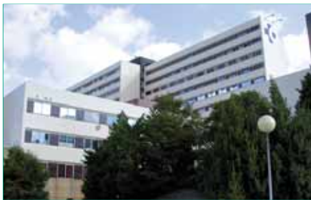
Hospital Galdakao-Usansolo de Vizcaya, sede de la Jornada sobre responsabilidad social corporativa.

En cuanto al desarrollo de la RSC en hospitales en comparación con su aplicación en la industria farmacéutica, cree que "ambos entornos tienen un denominador común: la salud, y como eje pivotal, al paciente y al profesional sanitario", por lo que, a su juicio, "existen matices en cuanto a la forma de desarrollar sus políticas de RSC", si bien los hospitales "con toda seguridad" han sido y siguen siendo los primeros en desarrollar una vocación social por antonomasia. La relación médico-paciente y médico-sociedad se desarrolla en los centros asistenciales y es por eso que la medicina y el profesional sanitario, dentro de sus diferentes responsabilidades, cumplen con un cometido encomiable y esencial. Otro aspecto diferente es que, como organizaciones, los unos aprenden de los otros en materia de RSC y comparten experiencias, que es lo que propugna la Unión Europea, su Foro de Expertos y las diferentes iniciativas gubernamentales y parlamentarias llevadas a cabo y desarrolladas actualmente con éxito en España en materia de RSC. Esta postura