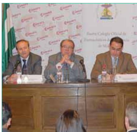
Entrega de la certificación ISO 9001 para el COF de Málaga.

Por otro lado, el último mes de 2010 también dejó constancia de la participación activa de los farmacéuticos españoles con la celebración del Día Europeo del Uso Prudente de los Antibióticos, iniciativa impulsada desde 2008 por el Centro Europeo para la Prevención y el Control de las Enfermedades. El objetivo: concienciar sobre los riesgos asociados a un uso inadecuado de estos fármacos y prevenir la aparición de resistencias bacterianas a los mismos. La Organización Farmacéutica Colegial lucha contra este importante problema desde hace tiempo. En esta ocasión, el CGCOF se encargó de elaborar un documento con los estándares de actuación profesional para la dispensación de antibióticos.