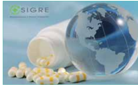
El compromiso en el Pacto Mundial se fundamenta, por ejemplo, en el fomento de la responsabilidad ambiental.

La entidad pone de manifiesto en este documento, que ya está disponible en su página web, los avances efectuados en materia de derechos humanos, en el ámbito laboral, en temas medioambientales y de lucha contra la corrupción en su actividad diaria.